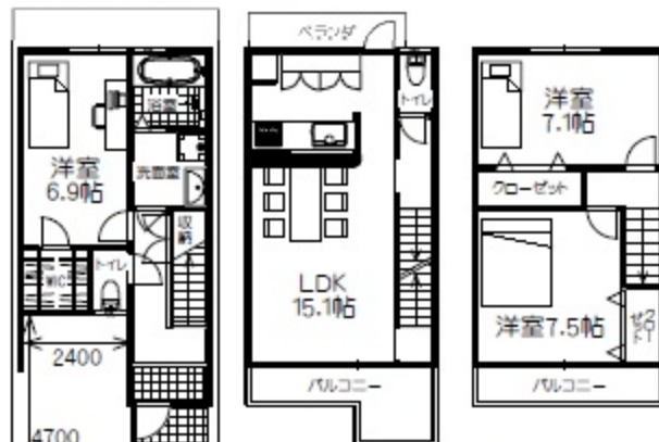
新築参考プラン 建延ベ:89.88㎡(27.18坪)